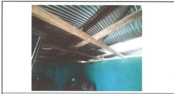
Foto 5: Sustitución de lámina, por lámina troquelada aluzinc calibre 26