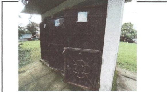
Foto 1: Mantenimiento a estructura (lijado, cambio de tubo , cepillado, sujeciones, aplicación de pintura) a puertas servicios sanitarios