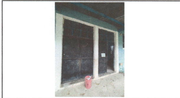
Foto 3: Mantenimiento a estructura (lijado, cambio de tubo , cepillado, sujeciones, aplicación de pintura)